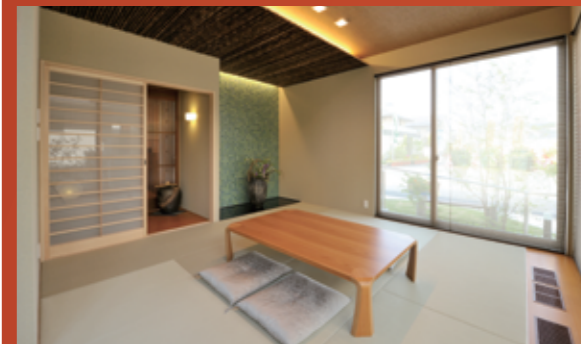
※一宮パルフェ展示場を2013年5月に撮影したものです。 ※写真内の家具調度品・家電等は表示価格には含まれません。 ※写真は展示場プランとは一部プラン・仕様が異なります。